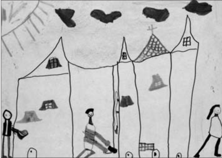
La ville dessinée dans une classe de maternelle après une projection de Katia et le crocodile , au Rex à Chatenay-Malabry.